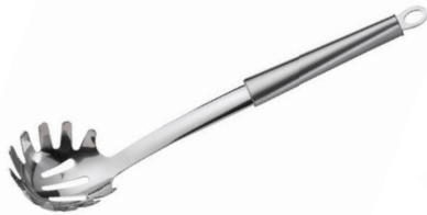
TENEDOR DE SPAGHETTI TWISTY DE ACERO INOX.