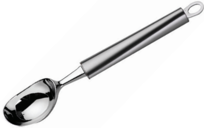
CUCHARA PARA HELADO RIVA DE ACERO INOX.