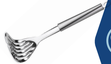
TRITURADOR DE PATATA TWISTY DE ACERO INOX.