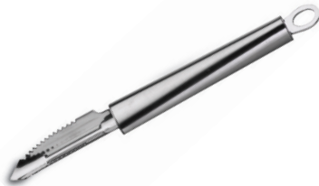
PELADOR DE VEJETALES TWISTY DE ACERO INOX.