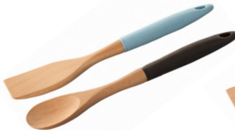
CUCHARA Y ESPATULA DE MADERA.