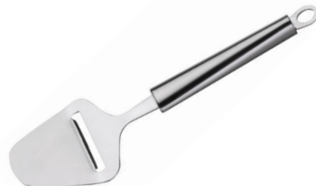
REBANADOR DE QUESO TWISTY DE ACERO INOX.