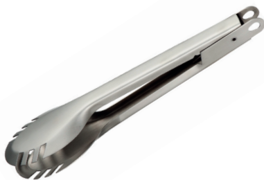
PINZAS PARA SERVIR TWISTY DE ACERO INOX.