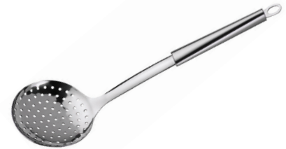
COLADOR ESPUMADERA TWISTY DE ACERO INOX.