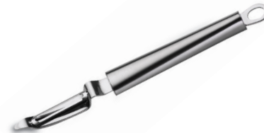
PELADOR DE FRUTAS TWISTY DE ACERO INOX.