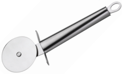
CORTADOR DE PIZZA TWISTY DE ACERO INOX.