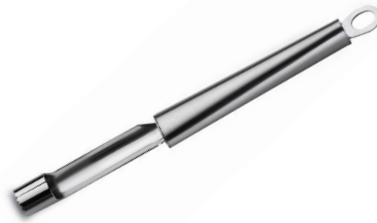
ESCARIADOR DE MANZANA TWISTY DE ACERO INOX.