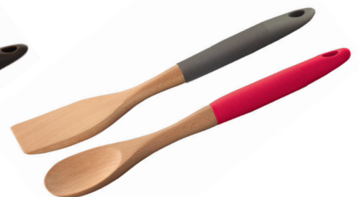
CUCHARA Y ESPATULA DE MADERA.