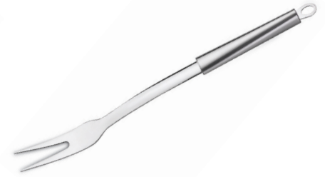
TENEDOR LARGO RIVA DE ACERO INOX.