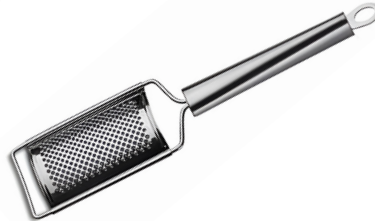
RALLADOR DE QUESO TWISTY DE ACERO INOX.