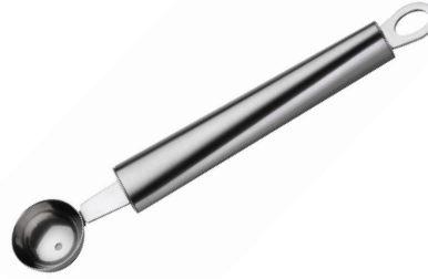
CUCHARA DE MELON RIVA DE ACERO INOX.